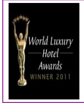
WORLD LUXURY – BEST LUXURY SPA RESORT