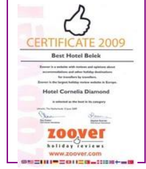
ZOOVER – BEST HOTEL BELEK