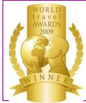
WTA – Turkey's Leading Spa Resort