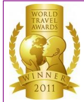
WTA – World's Leading Fully Integrated Resort