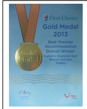
FIRST CHOICE – GOLD CHOICE