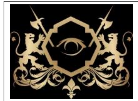
EYE AWARD – EUROPE'S BEST SPORT HOTEL