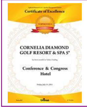
TOPHOTELS – Turkey's Leading Conference