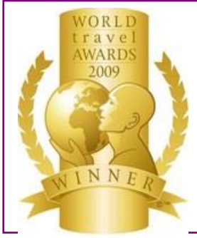
WTA – Europe's Leading Golf Resort