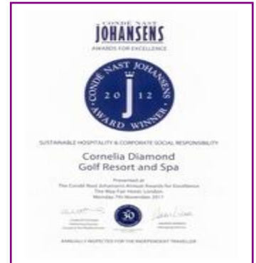
CONDE NAST JOHANSENS – WINNER (Sustainable Hospitality and Corporate Social Responsibility 2012)