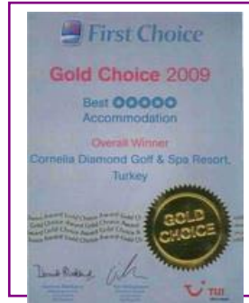
FIRST CHOICE – GOLD CHOICE