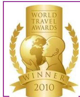
WTA – World's Leading All Inclusive Golf Resort