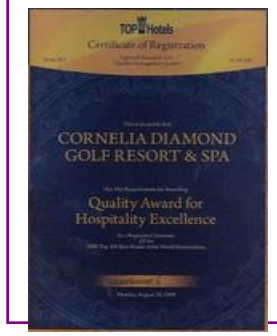
TOPHOTELS – AWARD for EXCELLENCE