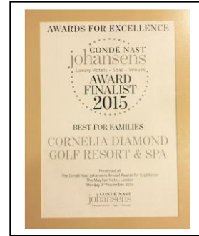
CONDE NAST JOHANSENS