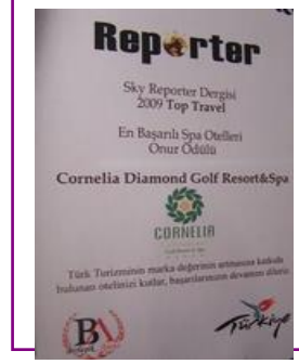
REPORTER MAG. – BEST SPA HOTEL