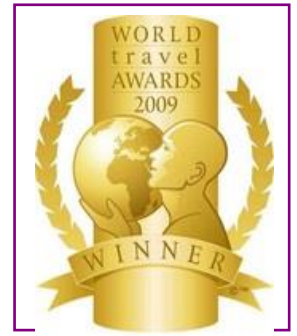
WTA – Europe's Leading Spa Resort