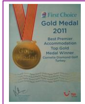
FIRST CHOICE – GOLD MEDAL