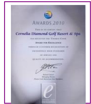
MARK for EXCELLENCE