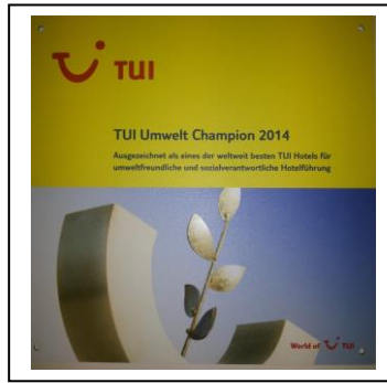
TUI – UMWELT CHAMPION