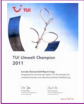
TUI – UMWELT CHAMPION