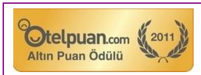
OTEL PUAN GOLD