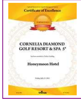
TOPHOTELS – Turkey's Leading Honeymoon