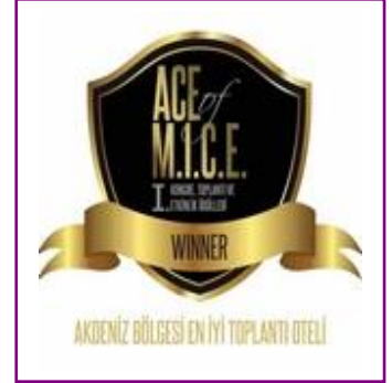
ACE of MICE – Best Congress Hotel in Antalya