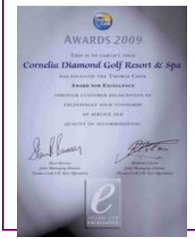
AWARD for EXCELLENCE