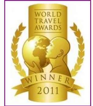
WTA – Europe's Leading Resort Villa