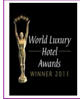
WORLD LUXURY – BEST LUXURY GOLF RESORT