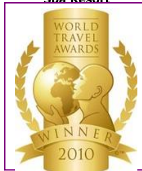
WTA – Europe's Leading Spa Resort