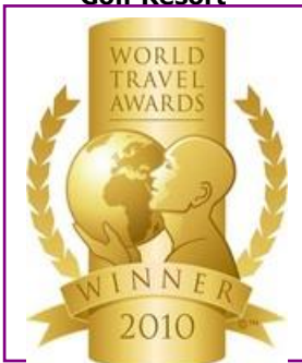
WTA – Europe's Leading Luxury Resort