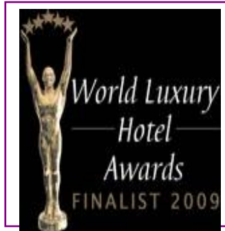
WORLD LUXURY – LUXURY GOLF RESORT