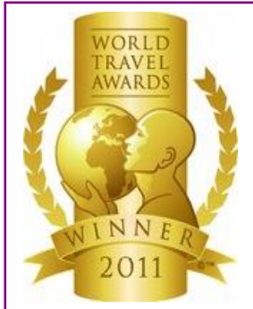
WTA – Europe's Leading Luxury Resort