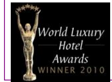
WORLD LUXURY – BEST LUXURY GOLF RESORT