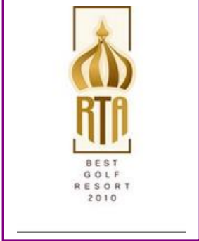
RUSSIAN TRAVEL AWARDS