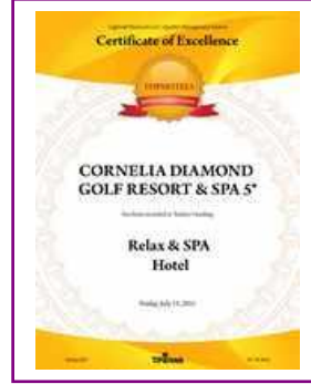
TOPHOTELS – Turkey's Leading Relax & SPA